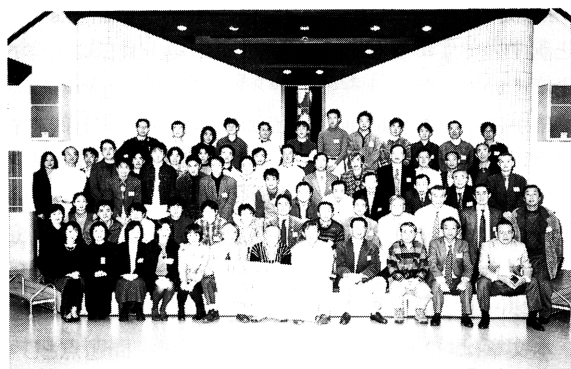
工学部岳稜会40周年記念集会 前列中央が筆者